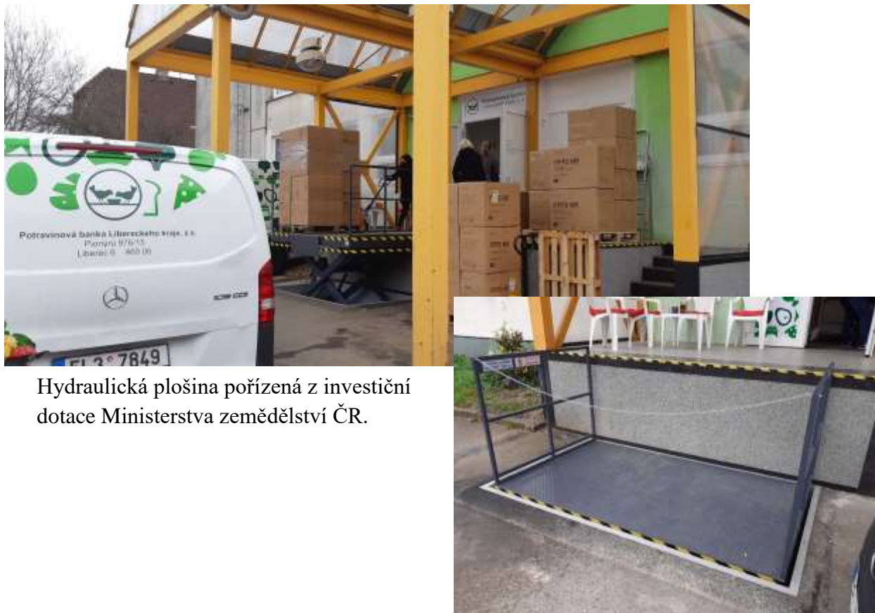
Hydraulická plošina pořízená z investiční dotace Ministerstva zemědělství ČR.