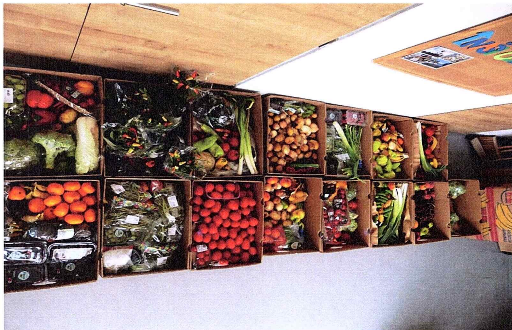
Ovoce a zelenina z Alberta.