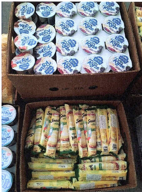
Dodávka čerstvých výrobků z Makra.

K dodávkám dochází v nepravidelných cyklech, sortiment a množství potravin se obměňuje. Nejčastější komoditou jsou čerstvé (tzv. fresh) potraviny, jako jsou jogurty, sýry, uzeniny, čerstvé mléko, ovoce a zelenina.